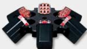
11156 6x13115 | 6x18015 | 72x15020

No. 11157 72 x 15 ml 4-15 max. 4.500 min -1 ≙ 4.120 x g 4K15 max. 5.100 min -1 ≙ 5.290 x g