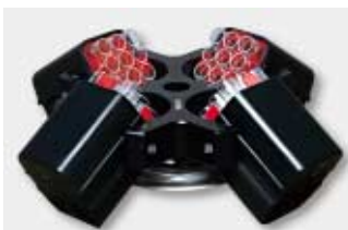
11140 4x13115 | 4x18015 | 48x15020

No. 11141 48 x 15 ml 4-15 max. 5.000 min -1 ≙ 4.420 x g 4K15 max. 5.500 min -1 ≙ 5.340 x g